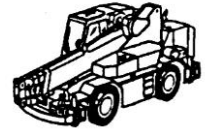
ラフテレーンクレーン