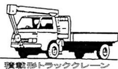
トラッククレーン